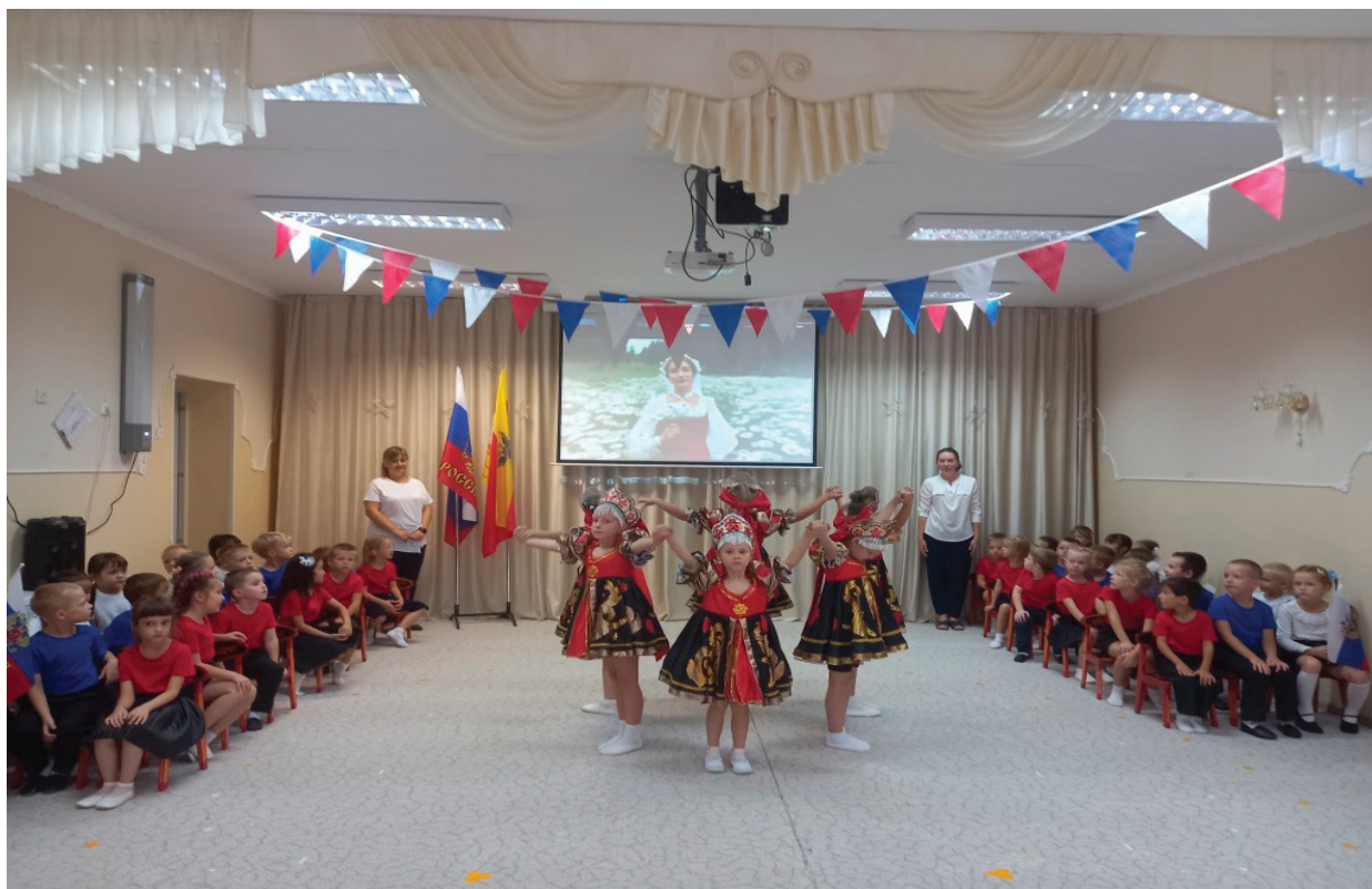
Рис. 3. День народного единства

ложительные качества. В этом случае ребёнок не только узнаёт новые слова, но и вслушивается в их интонации, что не менее важно для развития и обогащения эмоциональной сферы. В процессе такого взаимодействия дети получают массу положительных эмоций, они радуются, хлопают в ладоши, выражают свою доброжелательность и готовность к позитивному общению. При этом у детей снижается агрессивность, уменьшается или вовсе исчезают капризы и упрямство. Ведь мало кто захочет играть с упрямым капризулей или злоюшкой!