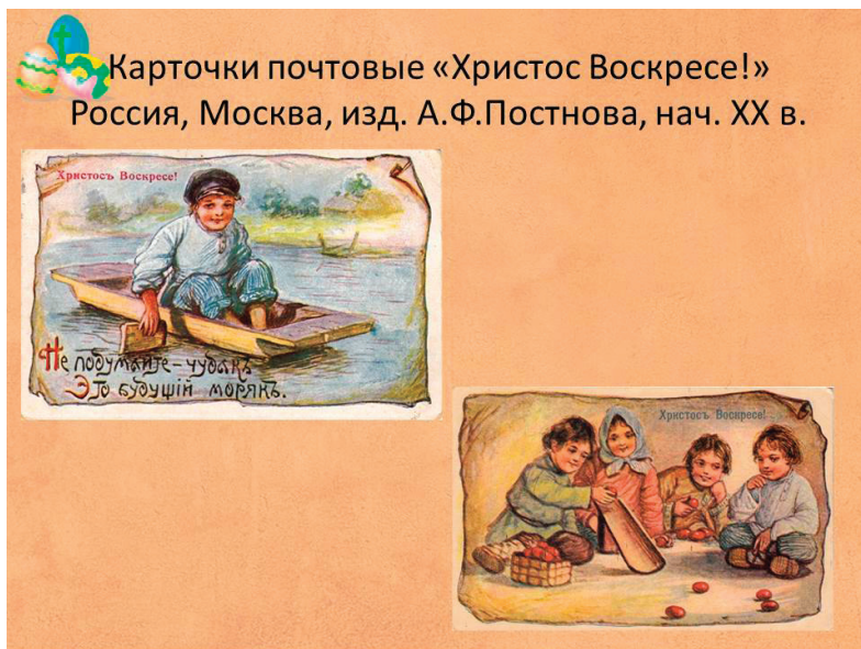
Рис. 3. Пасхальные открытки