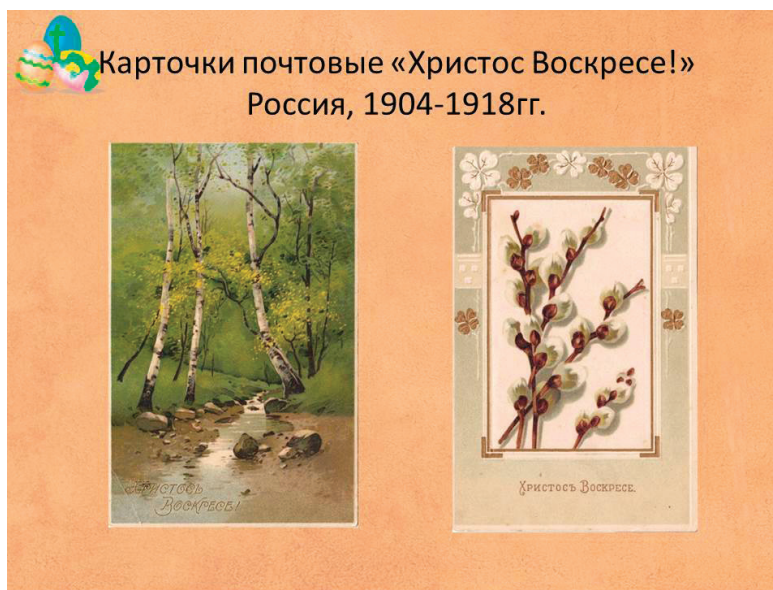
Рис. 2. Пасхальные открытки

Возродиться пасхальная открытка начала лишь в конце 1980-х годов во многом за счет тиражирования дореволюционных открыток (Рис. 7).