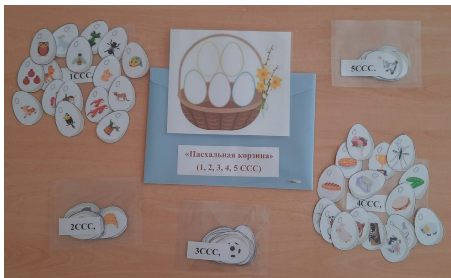
Рис. 1. Пасхальная корзина

У меня есть еще несколько корзинок, их необходимо заполнить крашенками, писанками. При заполнении корзины, необходимо четко, правильно называть изображенный предмет (Рис. 1).