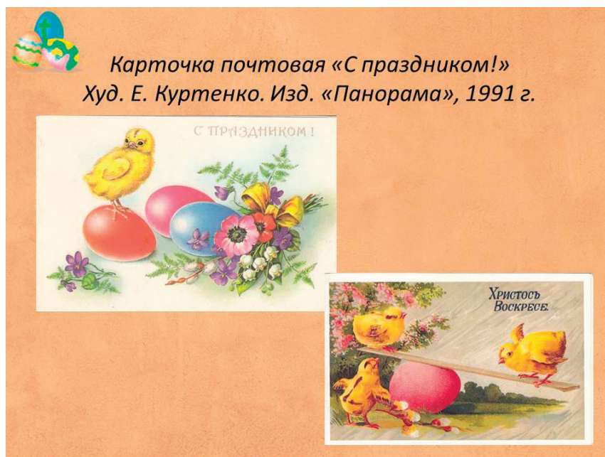
Рис. 7. Пасхальные открытки

Праздничные открытки хранились во многих семьях в течение многих десятилетий. Они были дороги как память о друзьях и родных или как напоминание о далекой молодости. Сегодня эти карточки ценятся как особый вид печатного искусства, не уступающий красотой и изяществом исполнения литографии или гравюре.