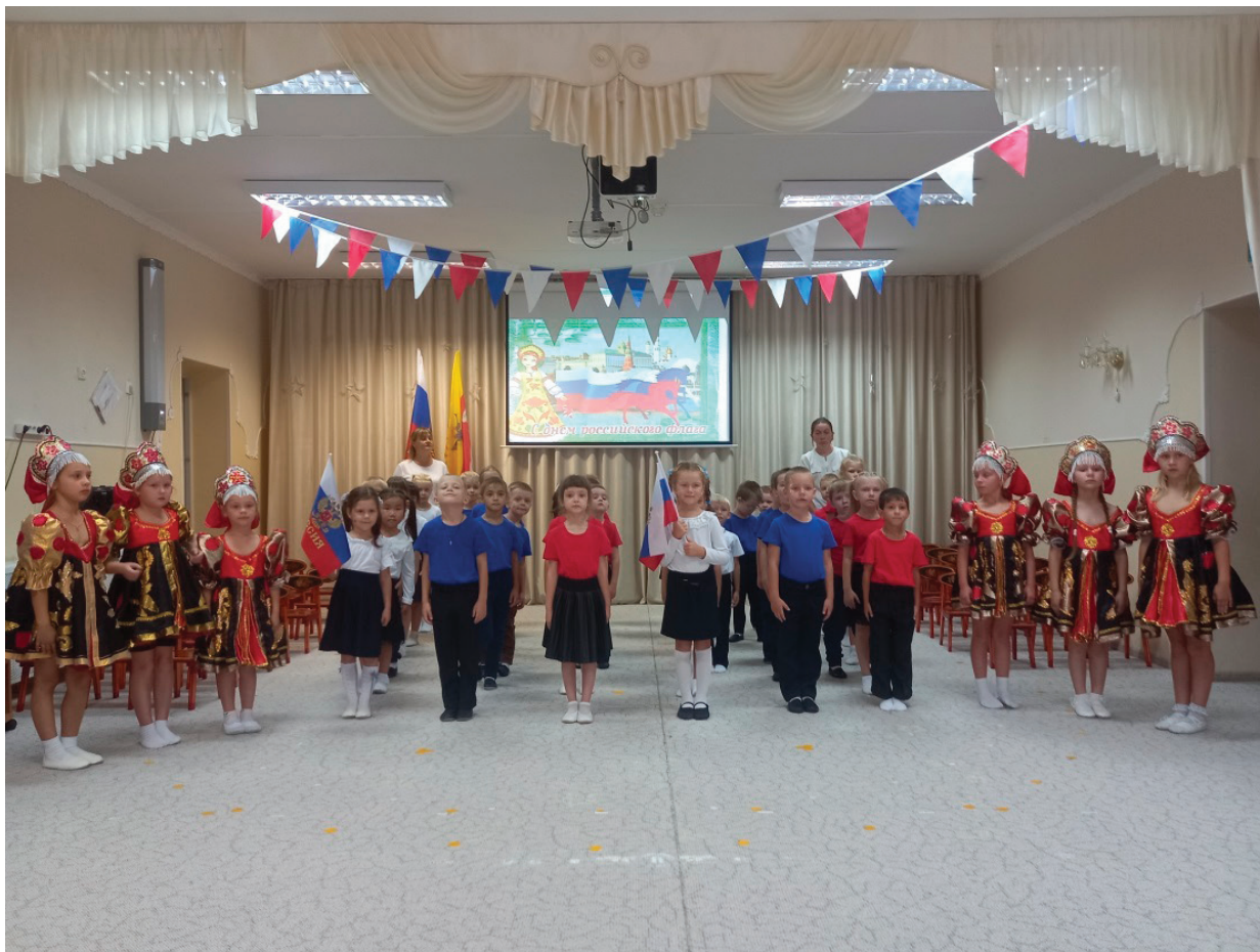
Рис. 1. День российского флага

На праздниках и мероприятиях, посвящённых таким датам, как День народного единства, День освобождения города, День Победы, День России, День российского флага, обязательно исполняется Гимн России. Дети старших и подготовительных групп знают слова Гимна и исполняют его.