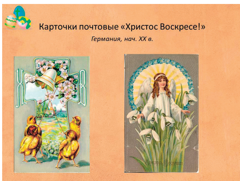
Рис. 5. Пасхальные открытки