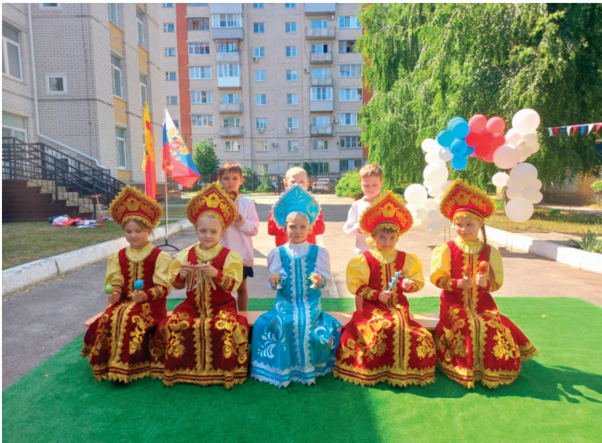
Рис. 2. День России

Первые годы жизни ребёнка — это важнейший этап воспитания. Начинают зарождаться и развиваться черты характера, играет роль и наследственный фактор; всё это вносит отпечаток в жизни ребёнка. Развитие и совершенствование языка, изучение букв и слов закрепляются ребёнком в играх, песнях, стихах, музыке, игрушках.