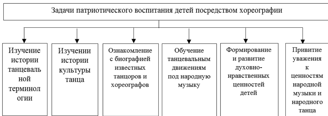
Рис. 1. Основные задачи патриотического воспитания детей на уроках хореографического искусства

На уроках хореографического искусства детям необходимо прививать, мысль, что танец является квинтэссенцией глубоких народных чувств и фантазий, включающей в себя яркое и красочное художественное отображение эмоций, а также — четкое содержание, тему и идею, что свойственному любому народному танцу. Посредством танцевальных движений и комбинаций дети должны учиться созданию художественного образа в рамках определенного народного сюжета, темы.