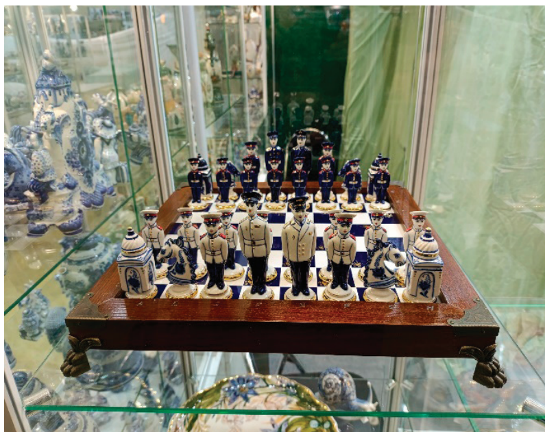
Рис. 2. Часть экспозиции работ «Союза Гжельских мастеров» на XXXVII выставке-ярмарке народных художественных промыслов России «Ладья. Весенняя фантазия». Весенняя фантазия».

Выставочный проект «Ладья» представляет собой единственную российскую площадку, охватывающую все направления народного искусства [10]. Для деятельности «Союза» участие в таких масштабных проектах имеет фундаментальное значение. Подобные мероприятия предоставляют не только платформу для демонстрации творческого потенциала его художников, но и способствует расширению аудитории ценителей гжельского промысла, что является ключевым фактором его популяризации в современном культурном пространстве.