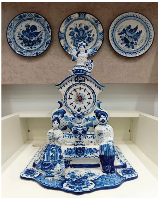
Рис. 5. Часть выставки работ мастеров на фестивале русской керамики «Гжельфест».

Программа мероприятия включала выставку произведений известных мастеров гжельского промысла и их учеников, выполненных в традиционных техниках: гончарство, майолика и фарфор (рис. 5). Также были организованы творческие мастер-классы по лепке, работе на гончарном круте, рисунку и росписи по фарфору, проводимые ведущими художниками промысла [14]. Реализованный формат фестиваля позволил гостям получить доступное, интересное и наглядное представление об истории, традициях и произведениях гжельской керамики, способствуя её популяризации в XXI веке.