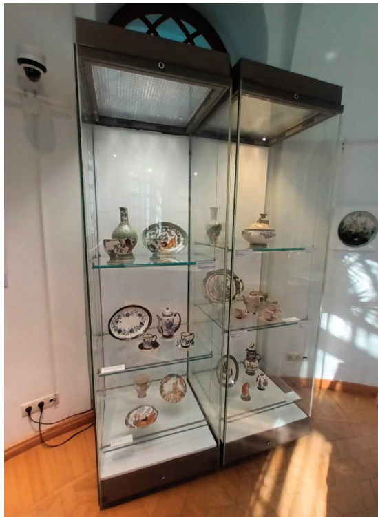
Рис. 3. Часть весенней и летней экспозиции выставки «Гжель. Времена года».

Следующая экспозиция, посвящённая осеннему времени года, была представлена с 1 сентября по 31 октября (рис. 4). Завершающая выставка цикла акцентировалась на зимней тематике, проходила с 8 декабря по 1 марта 2026 года [13].