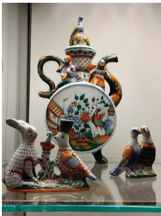
Рис. 4. Часть экспозиции осенней выставки «Гжель. Времена года», Фото предоставлено Юлией Ивановой

Следующая экспозиция, посвящённая осеннему времени года, была представлена с 1 сентября по 31 октября (рис. 4). Завершающая выставка цикла акцентировалась на зимней тематике, проходила с 8 декабря по 1 марта 2026 года [13].