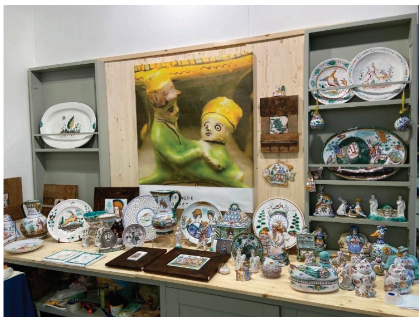
Рис. 1. Часть экспозиции работ «Союза гжельских мастеров» на V Художественно-промышленной выставке-форуме «Уникальная Россия».

В рамках выставки-форума с 23 по 26 января художники «Союза» представили свои работы (рис. 1).