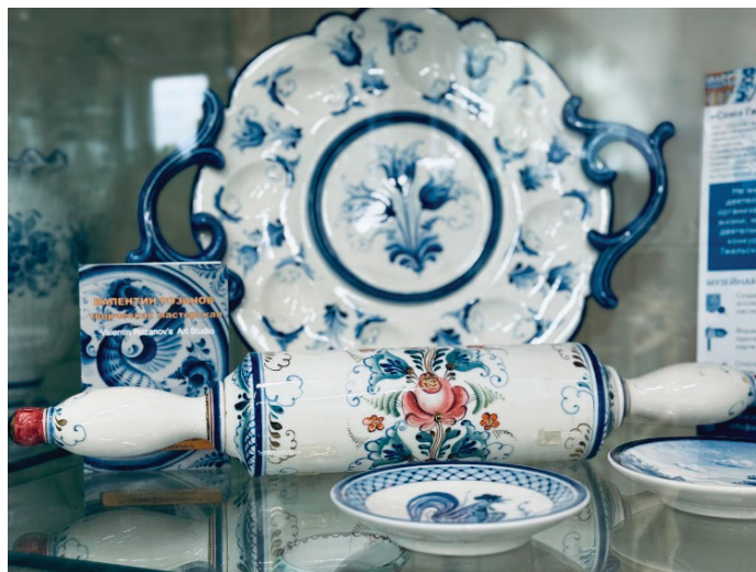
Рис. 6. Часть экспозиции музея современных авторских работ «Союз гжельских мастеров».