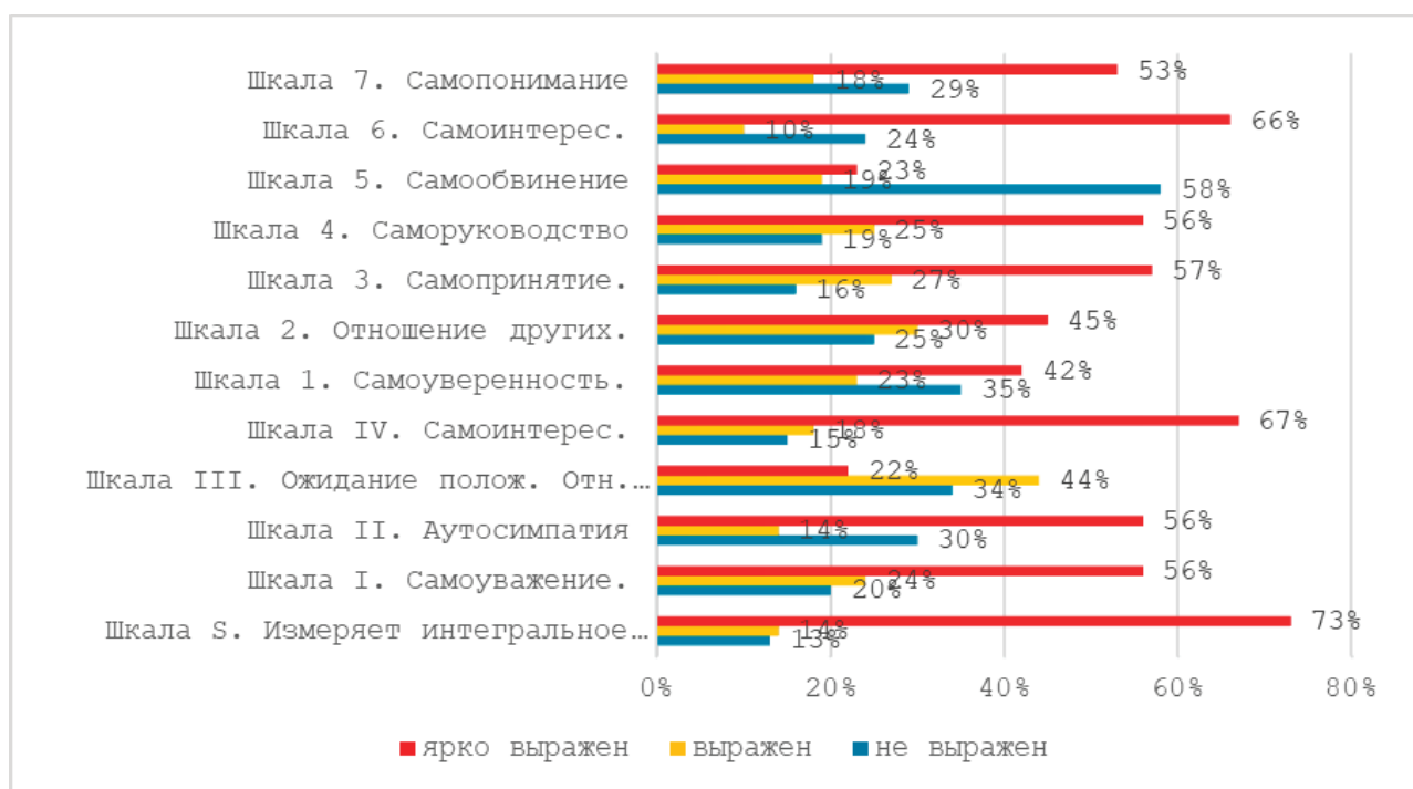
Рис. 2. Выраженность самоотношения по всей выборке (№ 100)

всеми показателями шкал особенностей волевой регуляции. Параметр «Интегральное самоотношение» показало среднюю положительную связь с пятью из шести показателями волевой регуляции. Единственной шкалой, показавшей обратную корреляцию по всем показателям волевой регуляции, стало «Самообвинение». Полученные данные могут свидетельствовать в пользу представления многих исследователей о взаимной детерминации волевой регуляции и самоотношения [2, 4, 5].