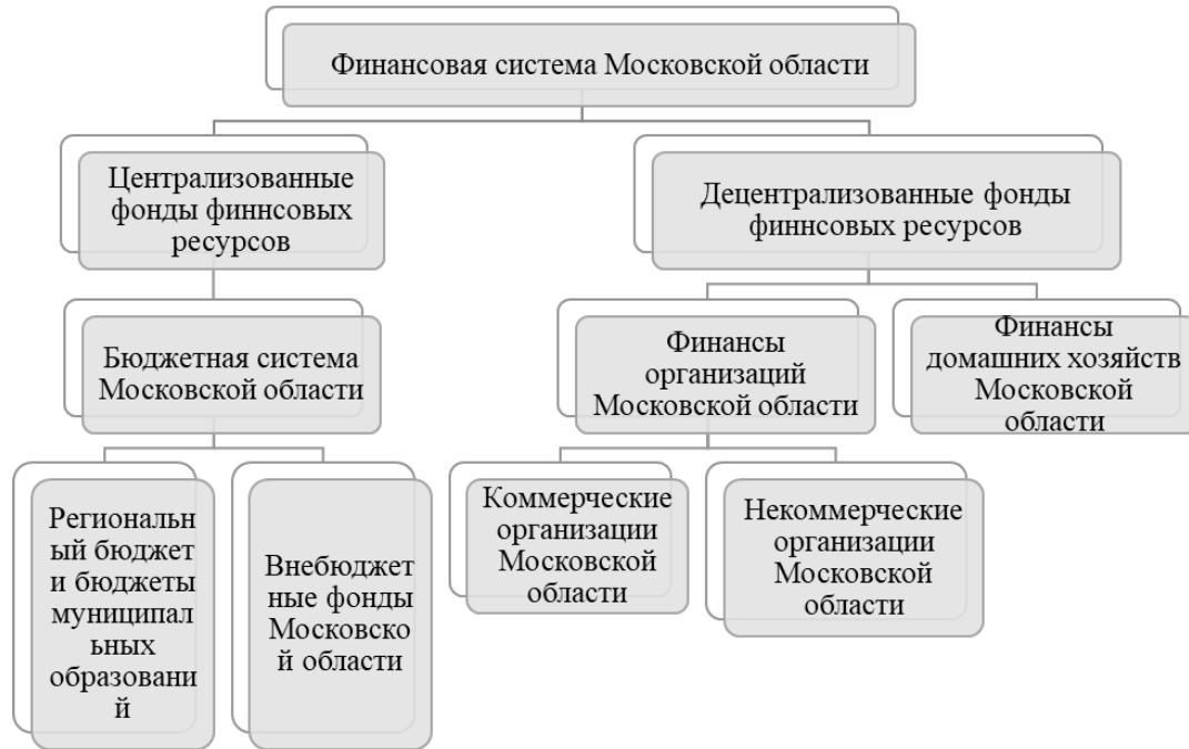
Рис. 1. Финансовая система Московской области

мент для обеспечения прозрачности и открытости государственных финансов. В Московской области роль такого контроля приобретает особое значение в контексте растущих потребностей населения и необходимости оптимального распределения бюджетных ресурсов.