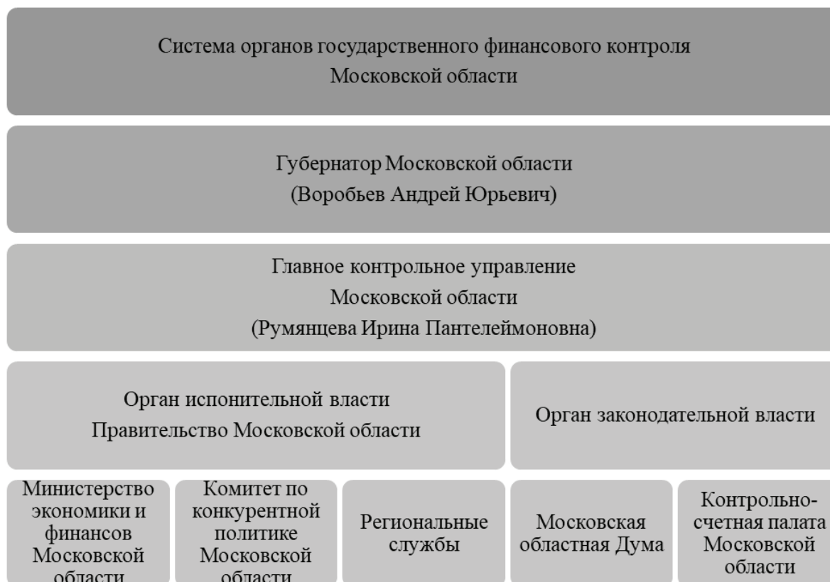
Рис. 2. Система органов государственного финансового контроля Московской области

гими государственными и муниципальными органами. Это важно для получения всей необходимой информации и обеспечения комплексного подхода к контролю. Кроме того, совместная работа с другими контролирующими учреждениями помогает оптимизировать ресурсы и избежать дублирования усилий.